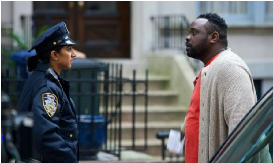
Sunita Mani et Brian Tyree Henry dans Outside Story