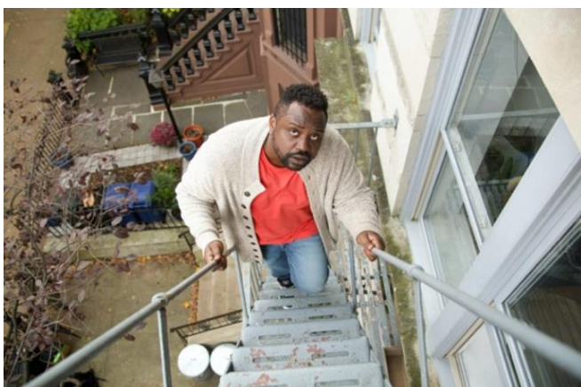
Brian Tyree Henry dans Outside Story

Je suis devenu un connaisseur de ce genre de vidéos (j'ai même réalisé la mienne en 2017...) puis j'ai construit mon premier long métrage autour d'un personnage qui était monteur de ces clips hommage - un travail parfait pour un réalisateur frustré qui se cache de la vie et qui s'immerge dans l'héritage d'autres cinéastes.